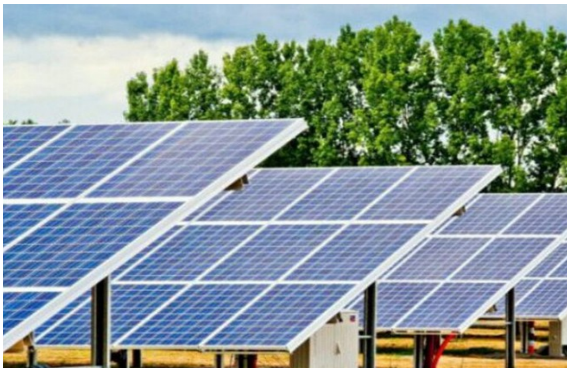
Exemple de centrale photovoltaïque au sol

Enquête réalisée du jeudi 18 avril 2024 au mercredi 22 mai 2024 par Hervé BILLIET, commissaire enquêteur